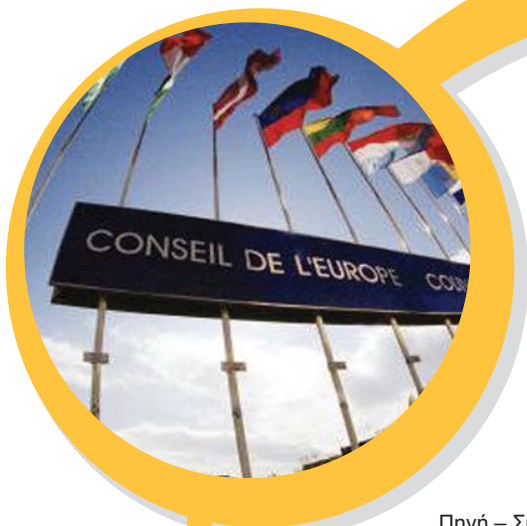
Πηγή – Συμβούλιο της Ευρώπης

Περισσότερες πληροφορίες μπορούν να δοθούν από τη Muriel Grimmeissen, Γραμματέα της Επιτροπής των Ειδικών www.coe.int/soc-sp