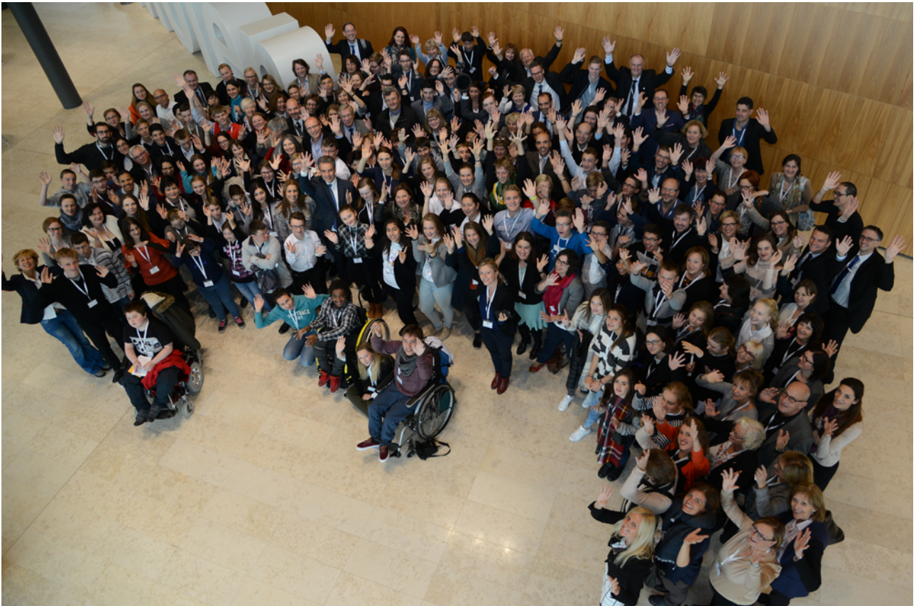
Afbeelding 5. Deelnemers van de Europese hoorzitting

De Aanbevelingen van Luxemburg werden aan de Ministerraad gepresenteerd tijdens de vergadering 'Education, Youth, Culture and Sports' op 23 november 2015, en aan het Onderwijscomité op 2–3 december 2015, zodat er rekening mee kan worden gehouden en om te dienen als een basis voor mogelijke verdere actie.