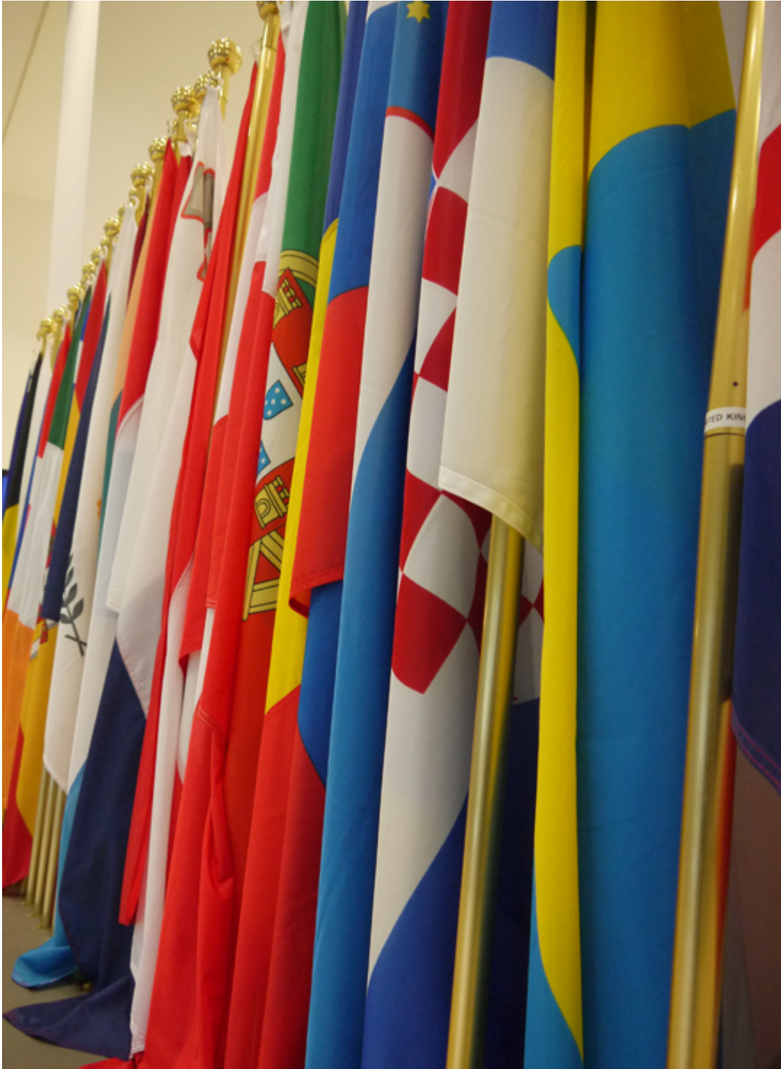
Afbeelding 1. Vlaggen van de lidstaten van de Agency