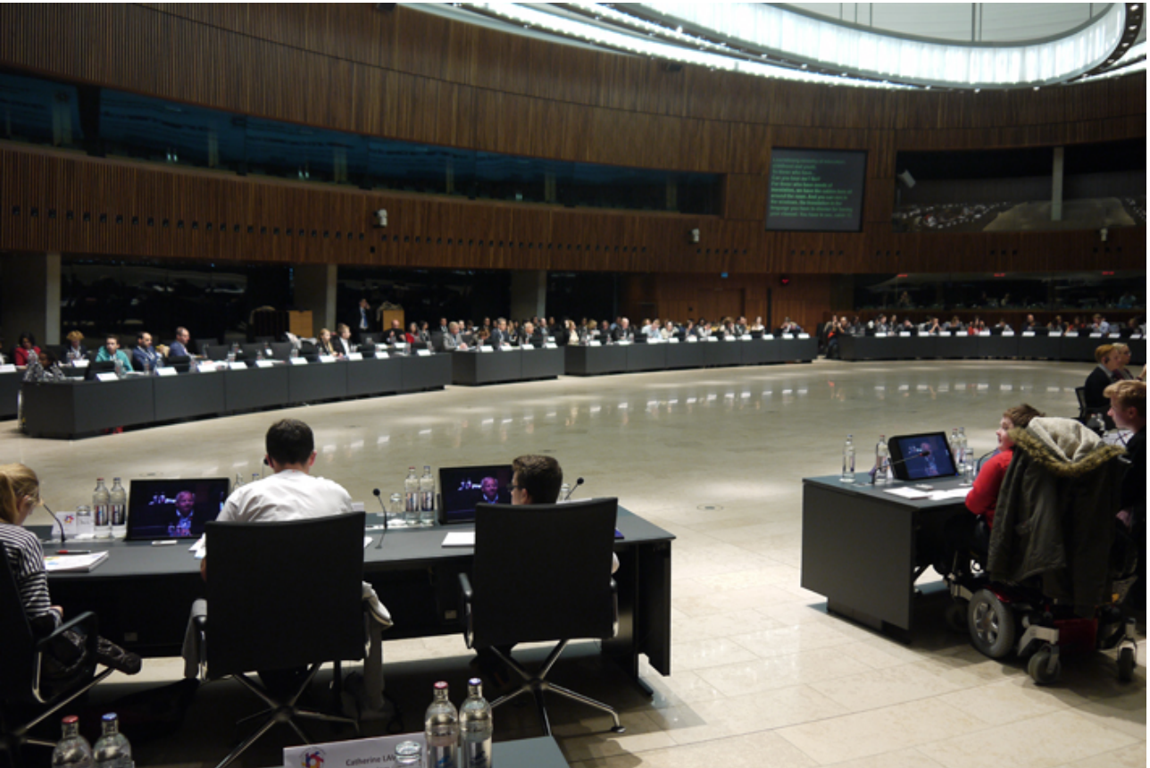
Afbeelding 2. Jonge afgevaardigden en andere vertegenwoordigers tijdens de Europese hoorzitting

voorwaarden aanwezig zijn. Deze aanbevelingen zijn gegroepeerd rond vijf kernboodschappen die de jongeren hebben verwoord tijdens hun besprekingen en de presentatie van de resultaten.