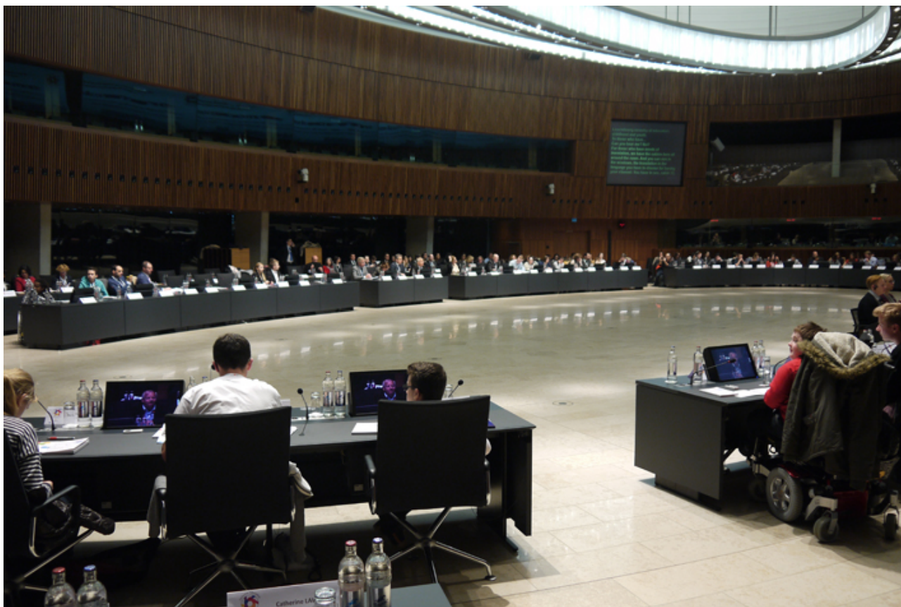
Figur 2. Unge delegater og andre representanter på den europeiske høringen

De viktigste resultatene fra gruppene ble presentert i plenumssesjonen i form av hovedpunktene som ble grunnlaget for innholdet i Anbefalingene fra Luxembourg .