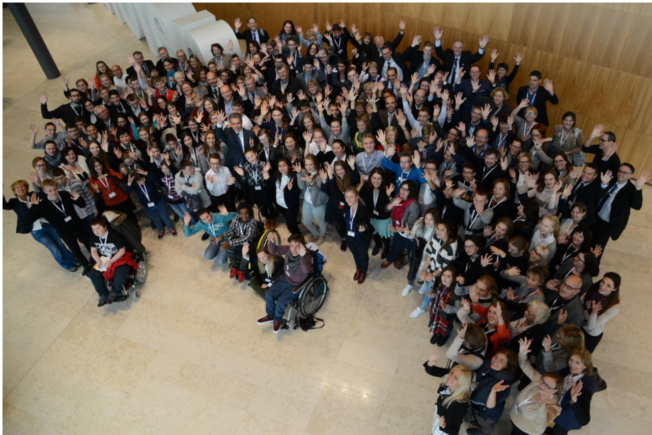
Figur 5. Deltakere i den europeiske høringen

Anbefalingene fra Luxembourg ble presentert for Ministerrådet under møtet om «Utdanning, ungdom, kultur og sport» den 23. november 2015 og for Utdanningskomiteen 2.–3. desember 2015, med tanke på videre diskusjon og som grunnlag for videre handling.