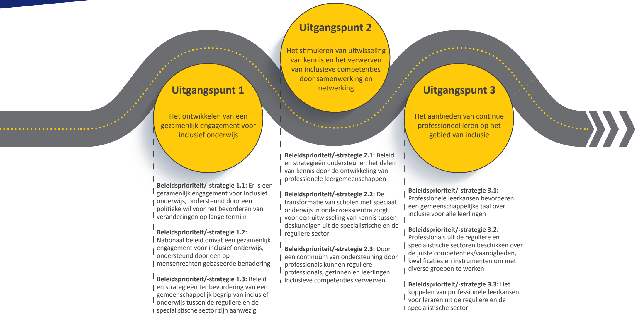
Afbeelding 2. Het CROSP-stappenplan