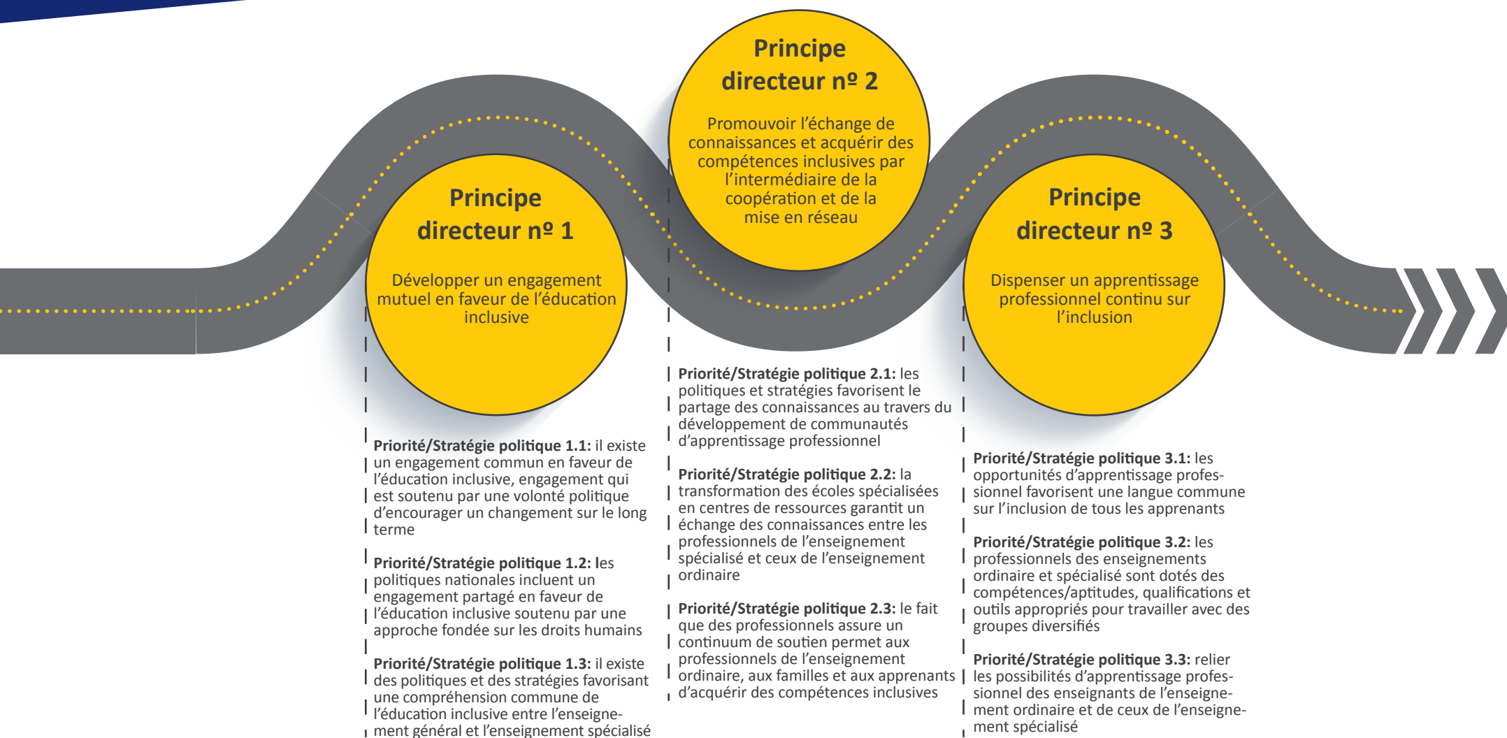
Figure 2. La feuille de route du projet CROSP